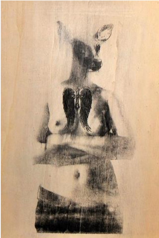
Barbara Cardinale, Les biches sont dans la niche , 2013, installation, transfert sur bois, 4 x 50 x 30 cm. (détail)