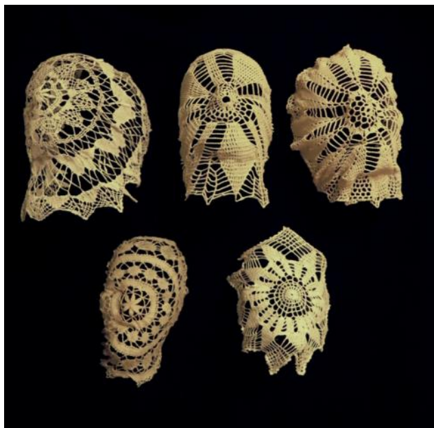
Marc Girard, Napperons , 2014, installation de 5 napperons anciens