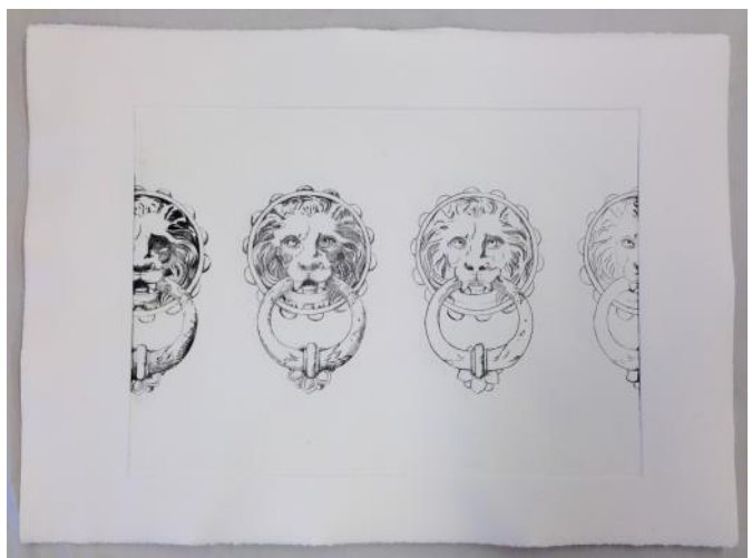
Luana Cruciato, Sans titre , 2013, gravure sur plexi, 40 x 60 cm.