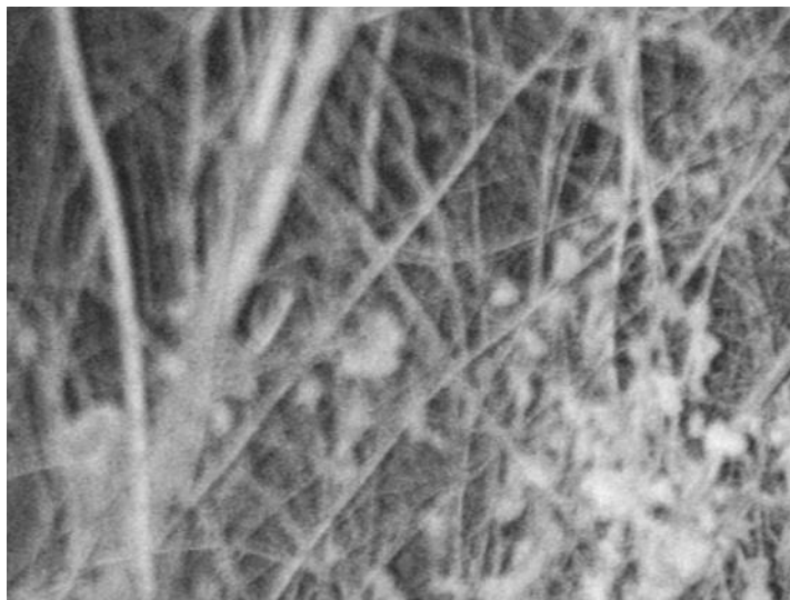
Marie Acker, Nox , 2013, série de 7 photographies noir/blanc sous verre, 30 x 40 cm.