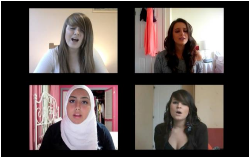
Camille Kaiser, Someone like you , 2012, video, 4'46" (still)