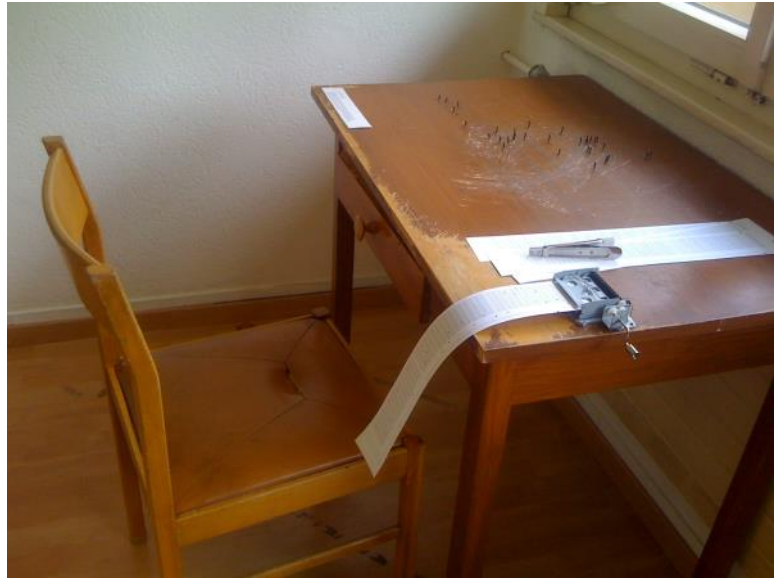
Mirella Salame, Footnotes , 2014, installation, table, clous, boîte à musique